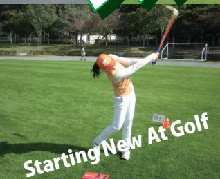
Starting New At Golf

スナッグゴルフでゴルフを楽しんでみませんか！ 名門ゴルフ場の芝生で楽しみながらゴルフの基本を覚えられる！